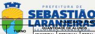
PLANILHA DE TRANSPORTE ESCOLAR